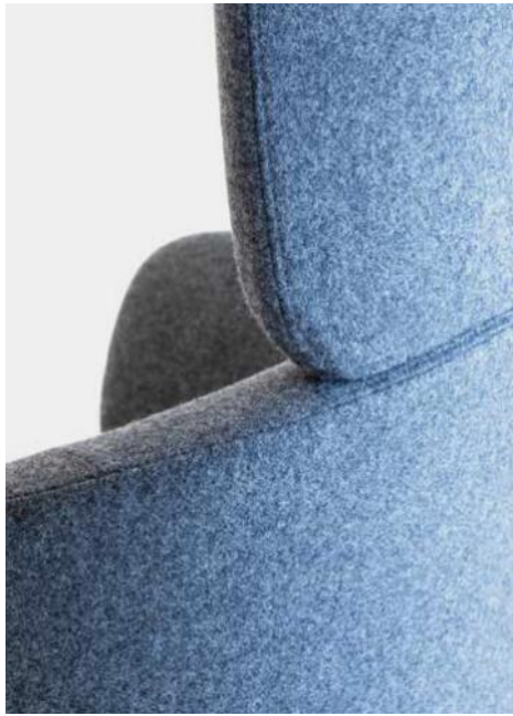
Dettaglio schienale, rivestimento in lana Backrest detail, wool upholstery Détail du dossier, revêtement en laine Detail der Rückenlehne, Stoffbezug aus Wolle