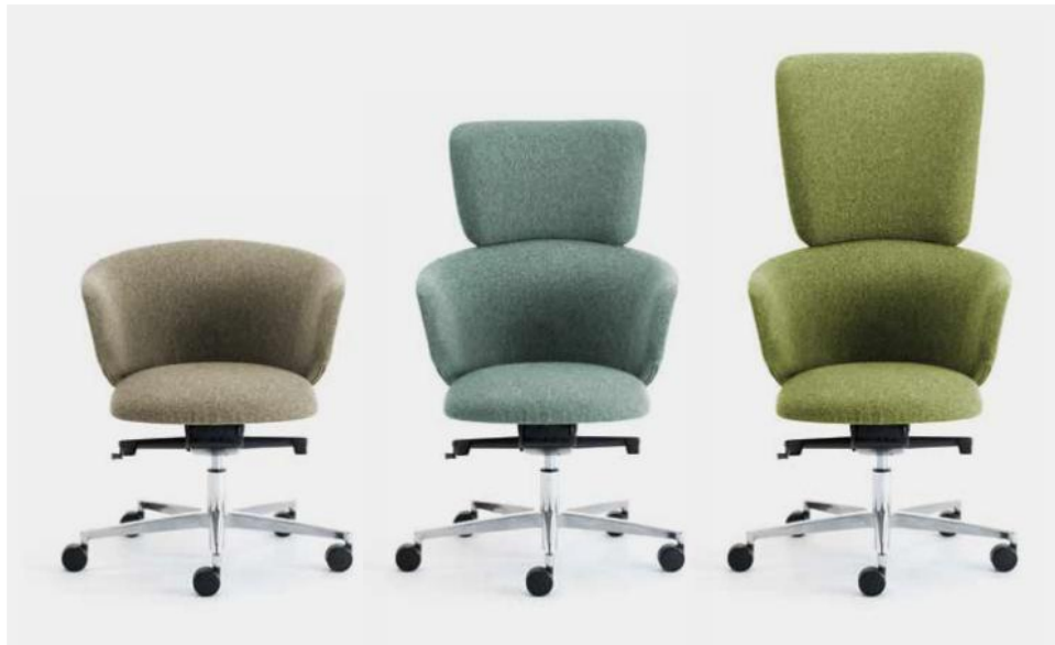
Differenti dimensioni e altezze dello schienale Different sizes and heights of backrest Différentes tailles et hauteurs du dossier Verschiedene Größen und Höhen der Rückenlehne